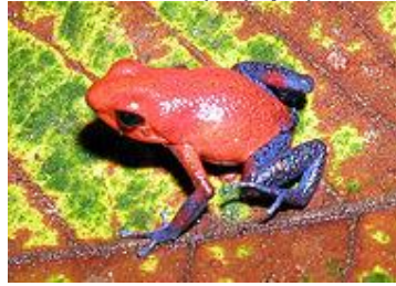
צפרדע "החץ המורעל"

מֵאֲפִיין: חֲסָרֵי זָנָב יש להם רגליים אחוריות ארוכות, גופם קצר. הם מתקדמים בניתורים או בטיפוס. הם חיים גם במים גם ביבשה. הנקבה מטילה כמות גדולה של ביצים. לאחר הבקיעה נולדים ראשנים שחיים במים בלבד. לראשן יש ראש וזנב. בהמשך הזנב נעלם והם הופכים לצפרדעים. החיה הארסית ביותר בעולם היא צפרדע הנקראת צפרדע חץ. האינדיאנים היו טובלים את ראש החץ בדם הצפרדע. מי שנפגע מת תוך זמן קצר.